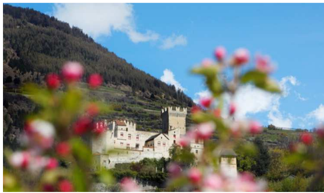
Churburg in Schluderns