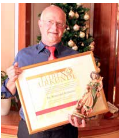
Passend zur Weihnachtsfeier des Weißen Kreuzes von Prad wurde der lang-