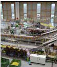
Bericht über die OVEG. Seite 12