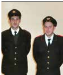
Versammlung der FF Lichtenberg Seite 16