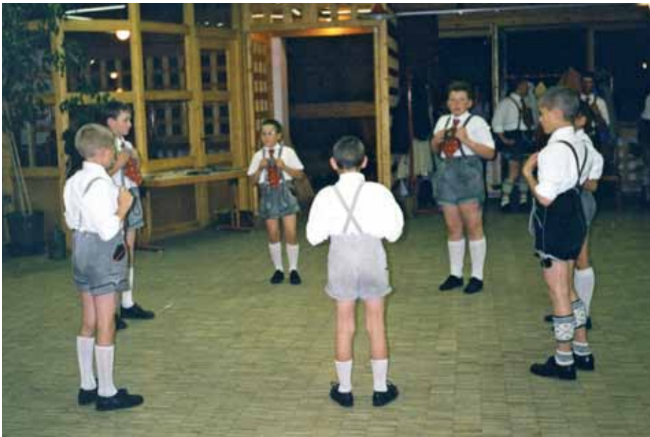
Im Bild eine frühere Jugendgruppe der Prader Schuhplattler.