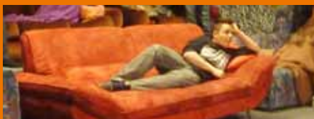
Bequemer geht's nicht!

Wie jedes Jahr fand auch dieses Jahr die Filmnacht für MittelschülerInnen begeisterten Anklang. Es wurde eine möglichst faire Arbeitsaufteilung getroffen um jedem die Chance zu geben etwas für die Gemeinschaft zu tun. Einige blieben die ganze Nacht wach und besuchten am nächsten Nachmittag schon wieder den Treff :)