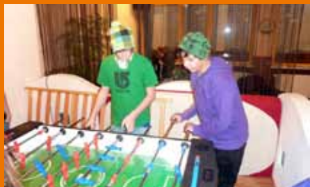
Die späteren Sieger beim Calcetto-Turnier

Voll motiviert stürzten sich alle Angemeldeten ins Geschehen. Es war sehr viel Energie und Einsatz bei allen vorhanden. Es war ein großer Spaß den SpielerInnen zuzusehen. Schlussendlich konnten sich wie schon beim letzten Turnier im November Team (Pippo/Mucho) durchsetzen und sich einen fixen Startplatz beim Calcetto Cup sichern.