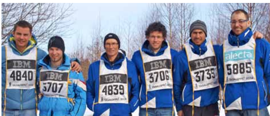
Unsere Teilnehmer beim Vasalauf in Schweden