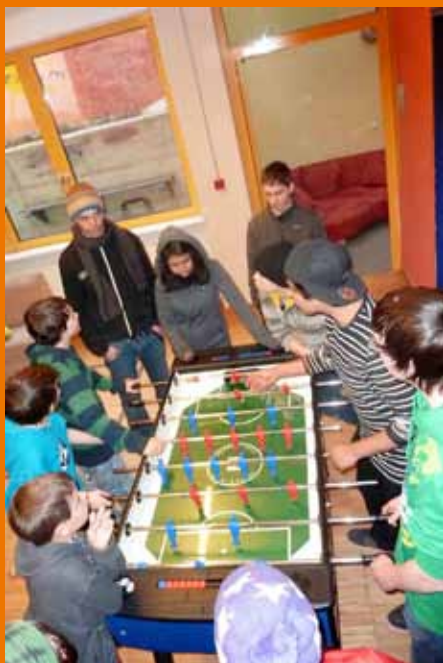
Die TeilnehmerInnen in Aktion