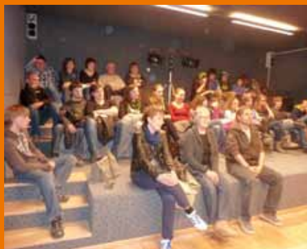
Der volle Medienraum

Am Freitag den 2. März wurde der Jugendtreff vom Theaterverein „Theaterspiel“ ( www.theater-spiel.de/ ) besucht, gefördert durch das Jugendkulturprogramm vom Amt für Jugendarbeit. Dabei wurde das Stück 2xHeimat (Ein Stück Kulturvielfalt vom Fremdsein und nach Hause kommen) aufgeführt. Der Medienraum des Treffs war bis zum letzten Platz gefüllt, einige mussten sogar auf den Stiegen sitzen. Die beiden Schauspielerinnen begeisterten das Publikum 60 Minuten lang und stellten sich anschließend den Fragen der interessierten Besucher. Zum Ausklang standen die beiden noch zum informellen Austausch mit interessierten Dagebliebenen zur Verfügung.