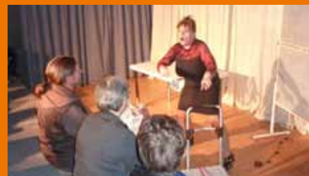
Voll im Einsatz

Am Freitag den 2. März wurde der Jugendtreff vom Theaterverein „Theaterspiel“ ( www.theater-spiel.de/ ) besucht, gefördert durch das Jugendkulturprogramm vom Amt für Jugendarbeit. Dabei wurde das Stück 2xHeimat (Ein Stück Kulturvielfalt vom Fremdsein und nach Hause kommen) aufgeführt. Der Medienraum des Treffs war bis zum letzten Platz gefüllt, einige mussten sogar auf den Stiegen sitzen. Die beiden Schauspielerinnen begeisterten das Publikum 60 Minuten lang und stellten sich anschließend den Fragen der interessierten Besucher. Zum Ausklang standen die beiden noch zum informellen Austausch mit interessierten Dagebliebenen zur Verfügung.