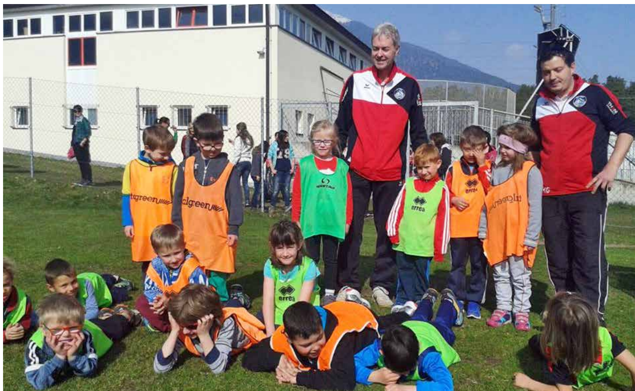
Der neue Bürgermeister ist bereits seit vielen Jahren im Dorf bestens integriert, nicht zuletzt auch durch seine verschiedenen Tätigkeiten im Prader Vereinsleben.

Wenn man sich die Sitze im neuen Gemeinderat ansieht, dann haben die beiden Oppositionsparteien der letzten Legislaturperiode insgesamt gleich viele Stimmen wie die Südtiroler Volkspartei. Das macht das Regieren spannend oder doch eher schwierig?